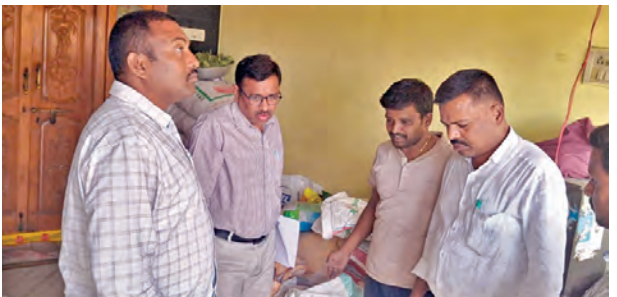
ఫలైజర్ దుకాణంలో తనిఖీలు నిర్వహిస్తున్న టాన్సెల్లర్ల అధికారులు

కళ్ల తెరిచి వడ్లతో పాటు తడిచిన ధాన్యం సైతం కొనుగోలు చేయాలని రైతుల వర్గంలో పెద్దపల్లె రైతుల రాజీవరచారులను దిగ్గొందం చేస్తామని హెచ్చరించారు. ఈ కార్యక్రమంలో గజ్వేల్ నియోజకవర్గ బిఆర్ఎస్ పార్టీ సీనియర్ నాయకులు, మాజీ ప్రజాప్రతినిధులు, మహిళలు, రైతులు పాల్గొన్నారు.