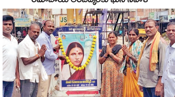
రమాబాయిఅంబేద్కర్ చిత్రపటానికి పూలమాలవేసి నివాళులర్పిస్తున్న దృశ్యం