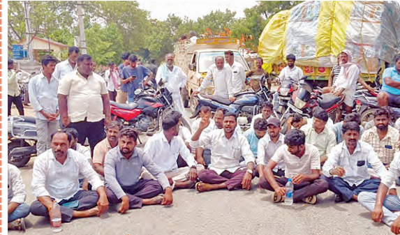
రోడ్డుపై బైతాయింది నిరసన తెలుపుతున్న రైతులు

గజ్వేల్ టౌన్, మే 27 (ప్రభాతవార్త): గజ్వేల్ మండలం బయ్యారం గ్రామానికి చెందిన రైతులు బుధవారం రోడ్డుపై బైతాయింది నిరసన వ్యక్తం చేశారు. ఈ సందర్భంగా వారు మాట్లాడుతూ బయ్యారం గ్రామ శివారులోని శారద రైస్ మిల్లు వారు వడ్ల తీసుకోమని అని చెప్పడంతో ధర్నా చేయడం జరిగిందన్నారు. అరుగం కళ్లపడి వేదించిన ధాన్యం అతని వర్గానికి తడిసిపోతుందన్నారు. ఎన్నికల ముందు అమ్మలకాని హామీలు ఇచ్చి గడ్డెక్కిన కాంగ్రెస్ ప్రభుత్వం రైతులను పట్టించుకున్న పాపాన చేలేదన్నారు. ఈ ప్రభుత్వ హయాంలో రైతులు వేదించిన పంటను కోనే దిక్కు లేదని విమర్శించారు. అధికారులు, ప్రభుత్వం స్పందించి రైతుల సమస్యలను పరిష్కరించాలని డిమాండ్ చేశారు. ఈ కార్యక్రమంలో బయ్యారం గ్రామ రైతులు పెద్ద సంఖ్యలో పాల్గొన్నారు.