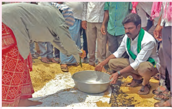
తడిసిన ధాన్యాన్ని పరిశీలిస్తున్న మాజీ ఎమ్మెల్యే రసమయి