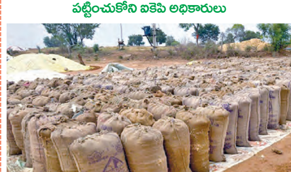
తడిచిన ధాన్యం బనాలు

బిలిపెడె, మే 27 ప్రభాతవార్త : మంగళవారం రాత్రి కురిసిన అతని వర్షానికి తడిసిన ధాన్యం తడిసి రైతులను కంటతడి పెట్టిస్తుంది. మెదక్ జిల్లా బిలిపెడె మండలంలో మంగళవారం అర్ధరాత్రి కురిసిన భారీ వర్షానికి ధాన్యం బనాలు, అరహాసిన ధాన్యం రాకుండా, తడిసి ముద్దయ్యాయి. ధాన్యం కొనుగోలు కేంద్రాలలో కనీస సౌకర్యాల తరలింపుకుండా అధికారులు అలసత్వం తోడ్కొని, రైతుల ధాన్యాన్ని కొనుగోలు చేసిన వెంటనే రైస్ మిల్లులకు తరలించాలి. కానీ పైజాబాడి గ్రామంలో తూకం వేసి వారం రోజులు గడుస్తున్నా రైస్ మిల్లులకు తరలింపుకుండా అధికారులు నిర్లక్ష్యం వహిస్తున్నారు. దీంతో అతని వర్షానికి తడిసిన ధాన్యాలు కాస్త తడిసి ముద్దయ్యాయని రైతులను ఆరోపించారు. ఎక్కడ చూసినా ఇదే పరిస్థితి ఏర్పడిందని, అధికారుల పనితీరుపై రైతులను ఆగ్రహం వ్యక్తం చేస్తున్నారు. అరుగం కళ్లపడి వేదించిన పంట వివరించి ప్రభుత్వానికి అమ్ముకోని అదాయాన్ని పొందే సమయంలో అధికారులు ఓట్లను, వర్షం మరో వైపు రైతుల కంటతడి పెట్టిస్తుంది. ఇప్పటికైనా అధికారులు వెంటనే స్పందించి పరి ధాన్యం కొనుగోలులో జాప్యం వహించకుండా వేగంగా కొనుగోలును జరిపి వెనువెంటనే ధాన్యం బనాలు రైస్ మిల్లులకు తరలించి రైతులకు న్యాయం చేయాలని వారి డిమాండ్ చేశారు.