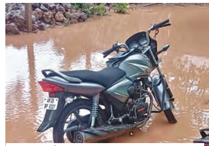
నాల్కల్లో ఇంటి ముందు నిలిచిన వర్షపు నీరు

నాల్కల్, మే 27, ప్రభాతవార్త: మంగళ వారం ఆర్ద్రరాత్రి నుంచి బుధవారం తెల్లవారం జాము వరకు మండలంలోని ఆయా గ్రామాల్లో భారీ వర్షం కురిసింది. మండలంలో 74.4 మి.మీ వర్షం పాతం నమోదునట్లు రెవిన్యూస్ ఆఫీసరులు దృవీకరిస్తున్నారు. గంటల తరబడి కురిసిన భారీ వర్షానికి గ్రామాల్లోని కాలువలు, వంకలు బొగ్గినాయి. పలు గ్రామాల్లో చెట్లు నేలకొరిగాయి. గంగూర్-అల్లూరుగల్ గోడ్రుపై చెట్లు పరిగిపోవడం ప్రయాణికులు కొంత అపస్వలం గురికావాల్సి వచ్చింది.