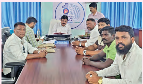
తడిసిన ధాన్యాన్ని కొనుగోలు చేయాలని ఆడిగి విన్నవించు సేతలు