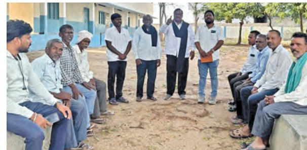
సమీక్ష సమావేశంలో పాల్గొన్న ఎమ్మార్పీలను నాయకులు