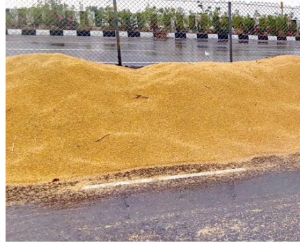
నర్సీను రోడ్డుపై అరబెట్టిన ధాన్యం వర్షానికి కట్టుకుపోయిన దృశ్యం